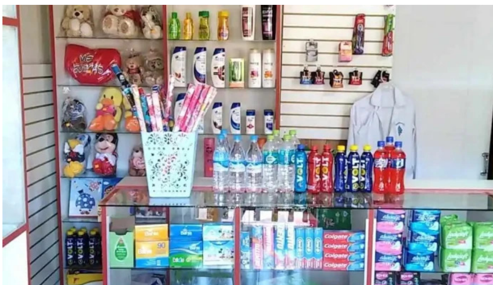
Mifarmacia cerca de mi