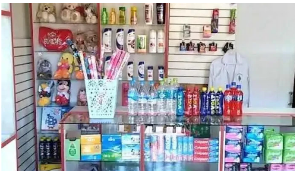
Mifarmacia ca ca 106