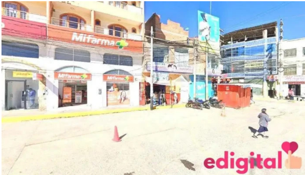
Inkafarma cerro de pasco