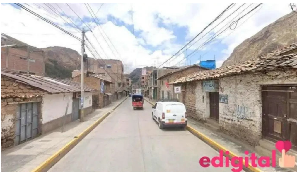
Farmacia cruz roja huancavelica