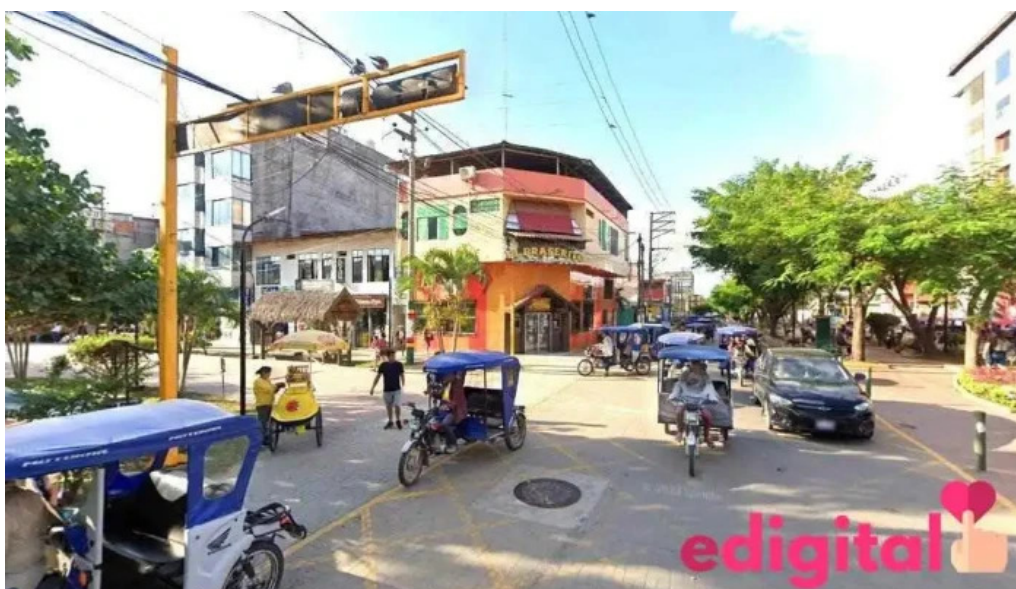
Dermalab botica pucallpa