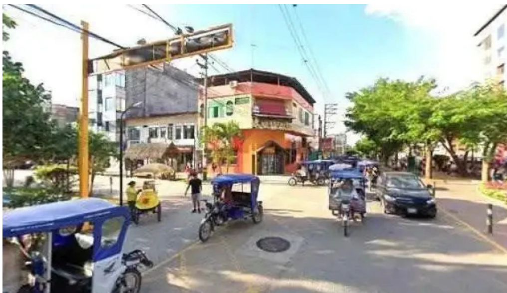
Dermalab botica ubicacion