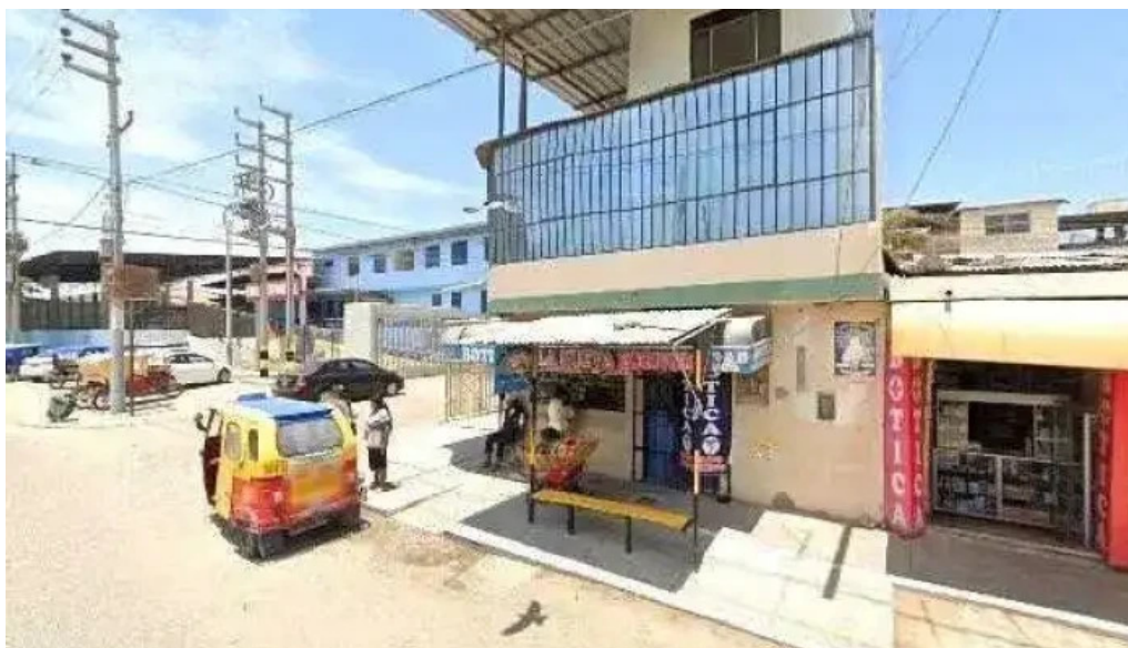
Farmacia salud vida comentarios