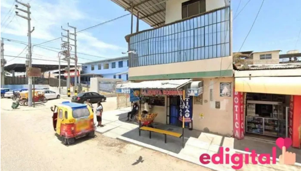
Farmacia salud vida sullana